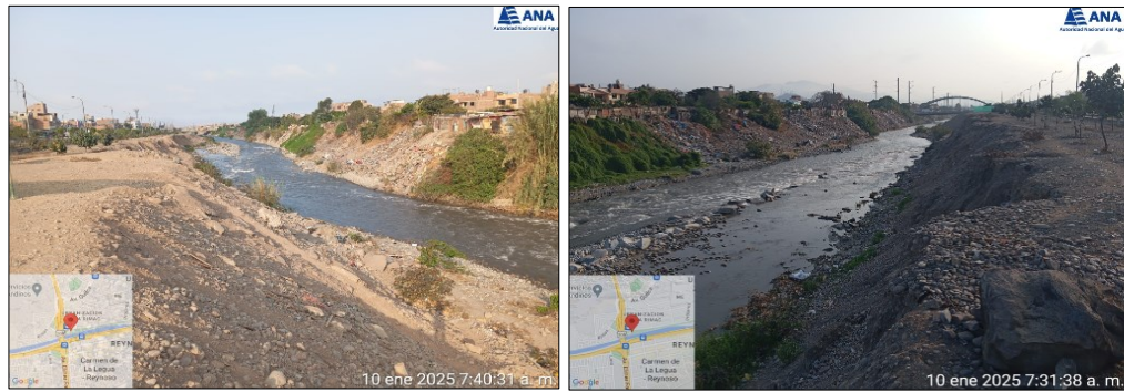
ZONA COLMATADA DEL RIO RIMAC